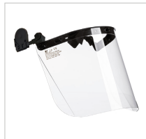
FACY PLUS COMBI Ref. 79712