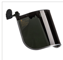
SUPERFACE COMBI GREEN Ref. 79715