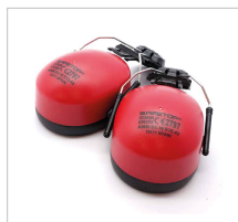
AUDITIVOS SONICO SET Ref. 82305