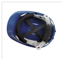
SUSPENSIÓN REF. 80529-SR Suspensión textil de 6 puntos de ajuste