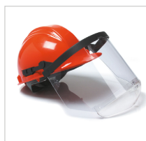
PERFO COMBI AC Ref. 79600