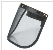
VISOR DE MALLA + SOPORTE Visor de malla: Ref. 79505 Para el acople del visor será necesario usar el soporte: Ref. 79745 y dos brackets (Ref. 79746).