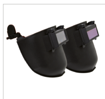
TODOS LOS MODELOS DE CATÁLOGO ACOPLABLES