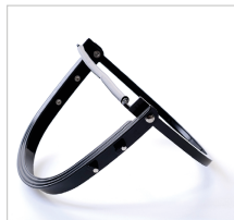
CARRIER UNIVERSAL Ref. 79174B Soporte carrier universal para acoplar visores a cascos. Válido para todos los modelos.