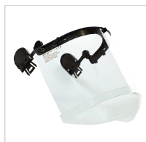
FACEMASTER COMBI Ref. 79209