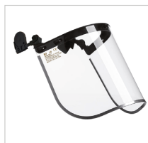
SUPERFACE COMBI Ref. 79710