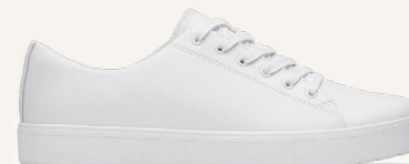
Old School IV Blanco: 38960