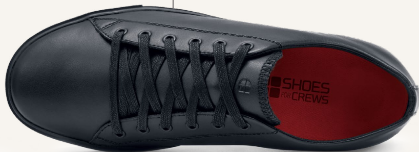
Plantilla extraíble de EVA acolchada

Peso (por zapato): 380 gramos (basado en el tamaño 42)