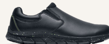
Cater II ECO: 42341