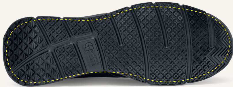
Construcción del talón para absorción de energía