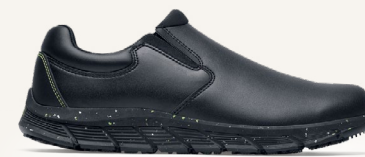
Cater II ECO: 42338