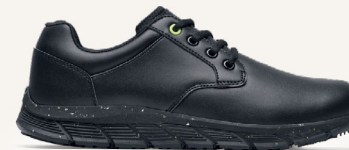
Saloon II ECO: 42337