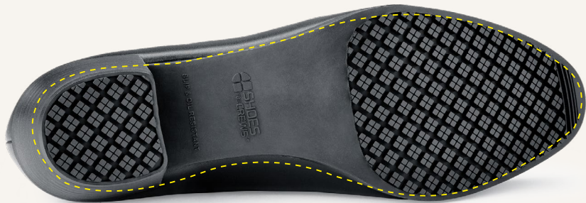
Construcción del talón para absorción de energía