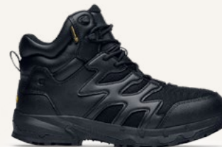
Carrig Mid: 62202