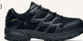
Carrig Low: 62201