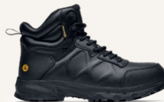
Callan Mid: 62204

Peso (por zapato): 526 gramos (basado en el tamaño 43)