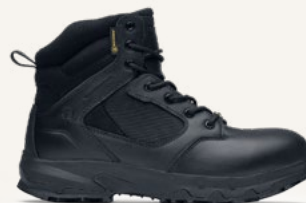
Defense Mid: 62210