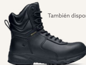
Guard High: 72238