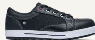
Fergus NCT Denim: 79778