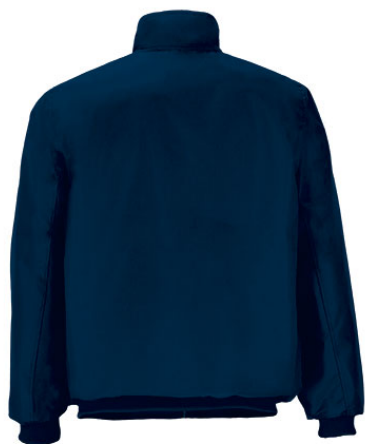
Vista parte trasera de la prenda (espalda)