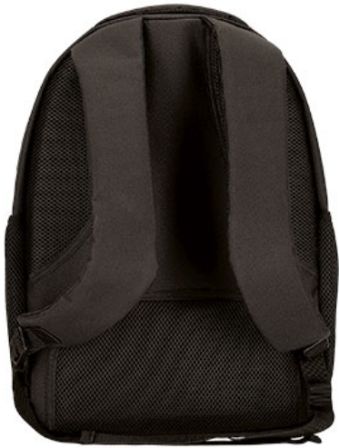
Vista parte trasera de la prenda