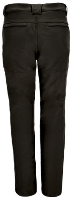
Vista parte trasera de la prenda