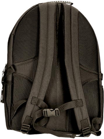
Vista parte trasera de la prenda