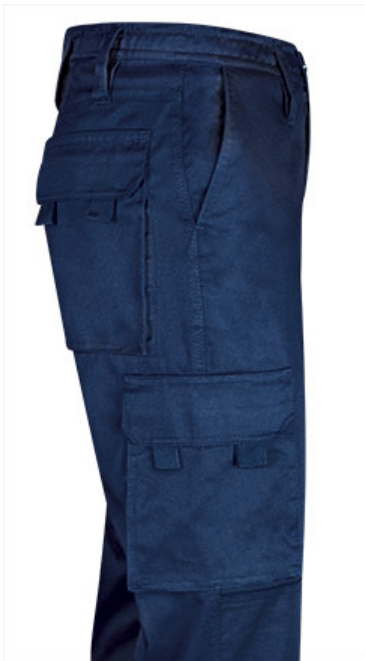
Detalle bolsillo lateral