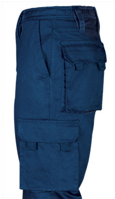
Detalle bolsillo lateral