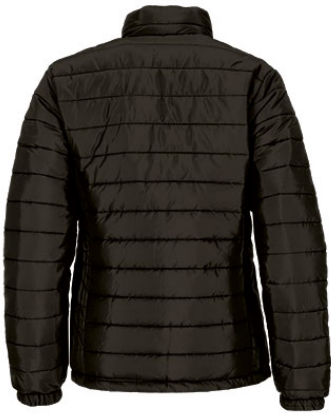
Vista parte trasera de la prenda (espalda)